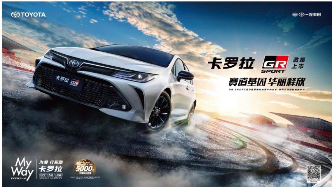
卡罗拉 GR SPORT