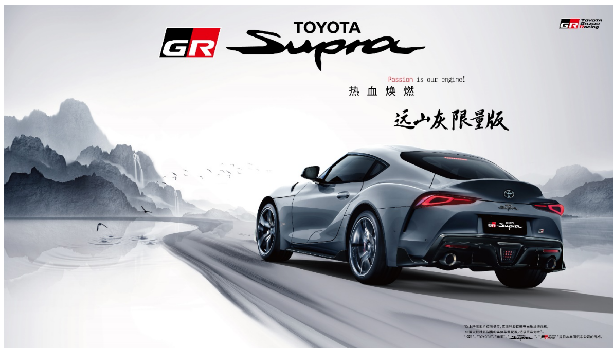
TOYOTA SUPRA 远山灰限量版