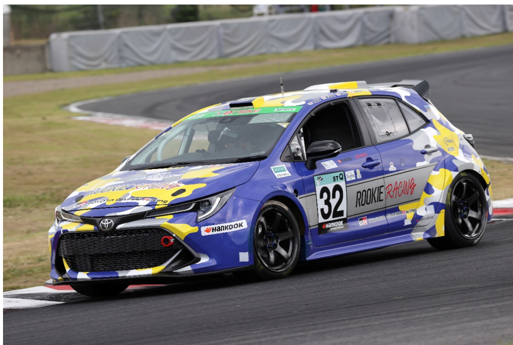
搭载氢燃料发动机的卡罗拉运动版赛车

经过 5 月下旬举办的富士 Speedway 站、7 月末举办的超级耐久赛 Autopolis、9 月下旬的超级耐久 SUZUKA（铃鹿）站的历练，氢燃料发动机在性能和加氢时间上都得到了显著提升：输出功率已经实现与汽油车相同的水平，加氢时间由首次参赛的 5 分钟逐渐缩短到 2 分钟。